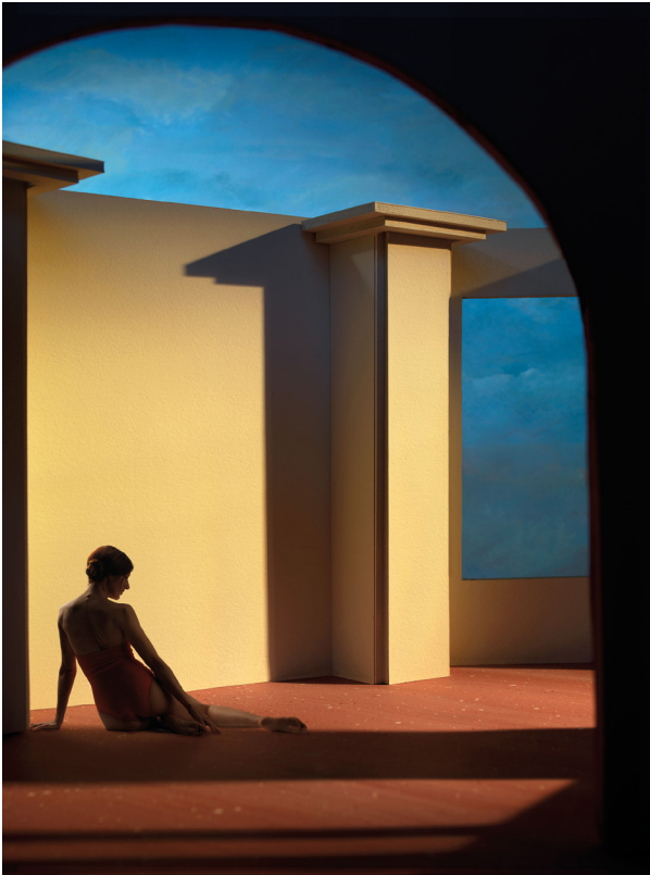
Socha, 2015, Clark et Pougnaud, Tirage pigmentaire sur Hannemühle, 50 x 40 cm, Tirage unique

Nous vivons aujourd'hui dans une surabondance d'images. Comment avez-vous eu l'idée de cette série où l'image, à l'inverse, en cache une autre et se soustrait à l'œil du spectateur ?