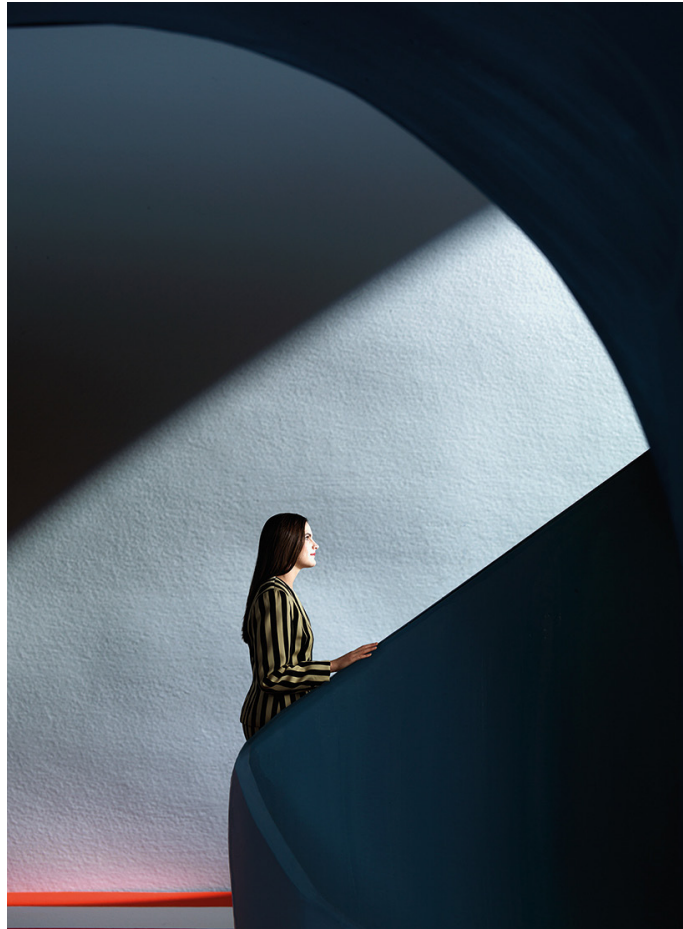
Charlotte , 2015, Clark et Pougnaud, Tirage pigmentaire sur Hannemühle, 50 x 40 cm, Tirage unique

« Nous ne nous interdisons pas de photographier la nudité, mais nous la soustrayons au regard. »