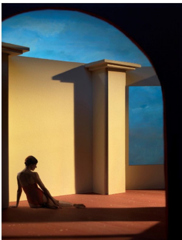
Socha , 2015, Clark et Pougnaud, Tirage pigmentaire sur Hannemühle, 50 x 40 cm, Tirage unique