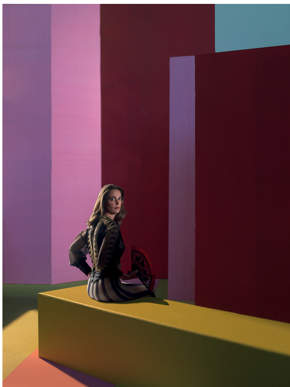
Pauline , 2015, Clark et Pougnaud, Tirage pigmentaire sur Hannemühle, 50 x 40 cm, Tirage unique