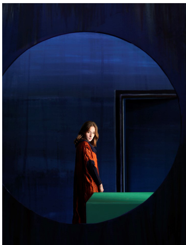
Yamée , 2015, Clark et Pougnaud, Tirage pigmentaire sur Hannemühle, 50 x 40 cm, Tirage unique