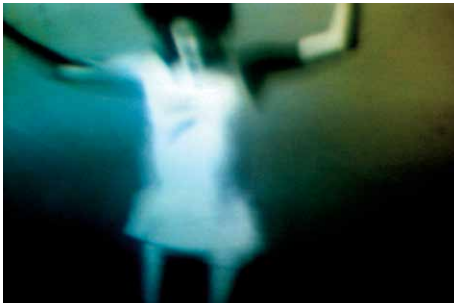
Normandie, 1999

Vernissage mercredi 17 février de 18h à 21h à la Mairie du 3 e arrondissement