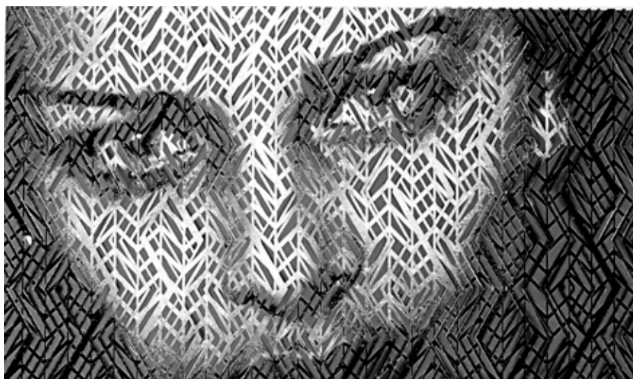
Lost Effect 01, 2015

Maurice Renoma présente ses 23 ans de photographie à travers une rétrospective de plus de cent œuvres ainsi qu'une sélection de créations graphiques inédites.