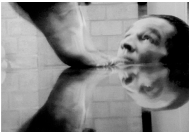
Mystères, 1998 – conception graphique Maurice Renoma

Pré-finissage mercredi 10 mars de 18h à 21h