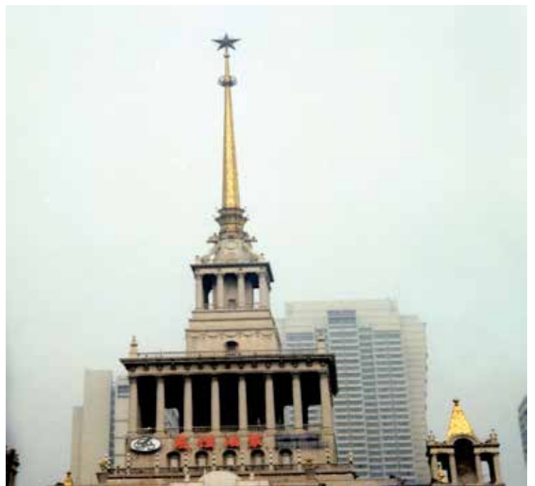
Chine, 856, 1994 - © Maurice Renoma

GALERIE LE BALLON ROUGE - 10, RUE DES GRAVILLIERS - 75003 PARIS WWW.LEBALLONROUGE.PARIS DU LUNDI AU DIMANCHE DE 10H À 12H ET DE 13H À 19H