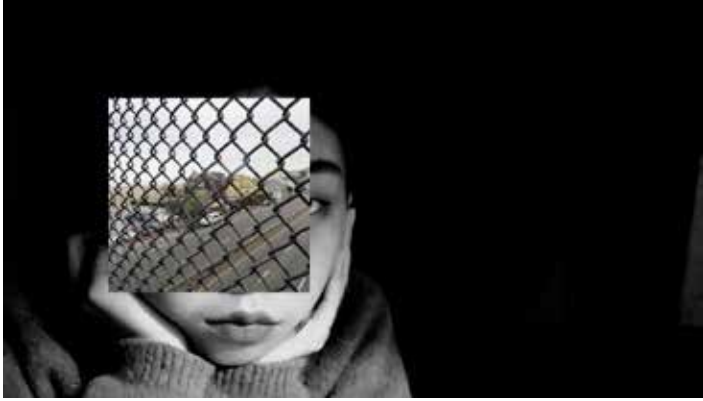
Lost Effect 03, 2015

Vernissage mercredi 24 février de 18h à 21h