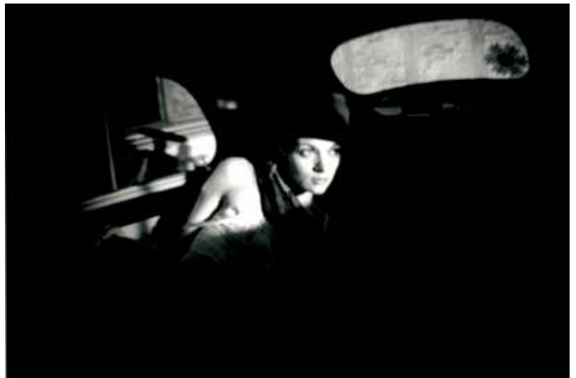
Normandie, 1994

La galerie mêle les artistes issus d'horizons différents pour ainsi entrechoquer les cultures mais également pour favoriser les échanges culturels et artistiques.