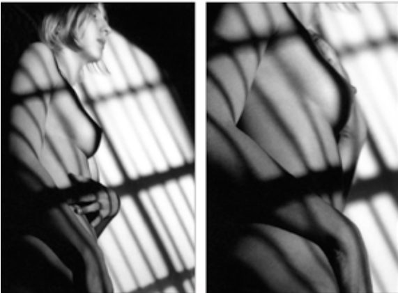
Florence, 1999 - © Maurice Renoma

Maurice Renoma s'approprie pour la première fois la photographie, en célébrant le corps féminin. Acte Pulsionnel représente donc un langage novateur pour l'artiste, élargissant son itinéraire de vie et son domaine d'action. Les préoccupations esthétiques de l'artiste sont pleines de liberté et de sentiments à vif.