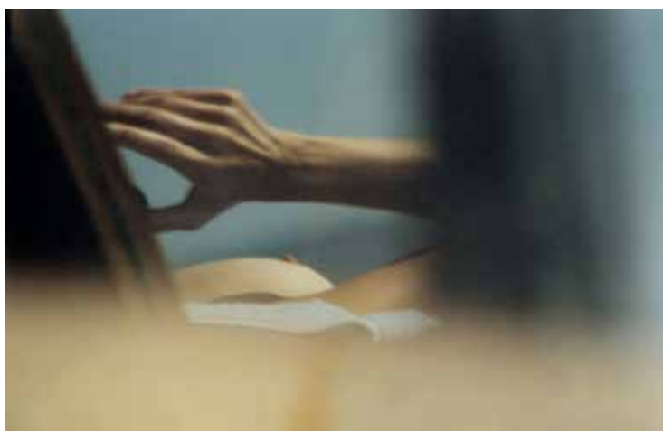
Mystères, 393, 1997

GALERIE PHOTO12 - 10, RUE DES JARDINS SAINT PAUL - 75004 PARIS WWW.GALERIE-PHOTO12.COM DU MARDI AU SAMEDI DE 14H À 18H30 ET SUR RENDEZ-VOUS