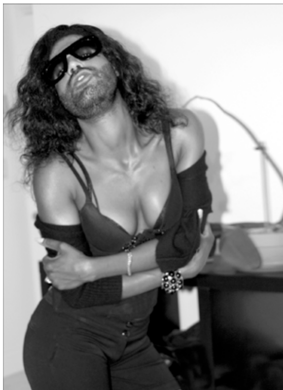
Mythologies II, 922-757, 2013 - © Maurice Renoma

Vernissage mercredi 17 février à 18h à 21h