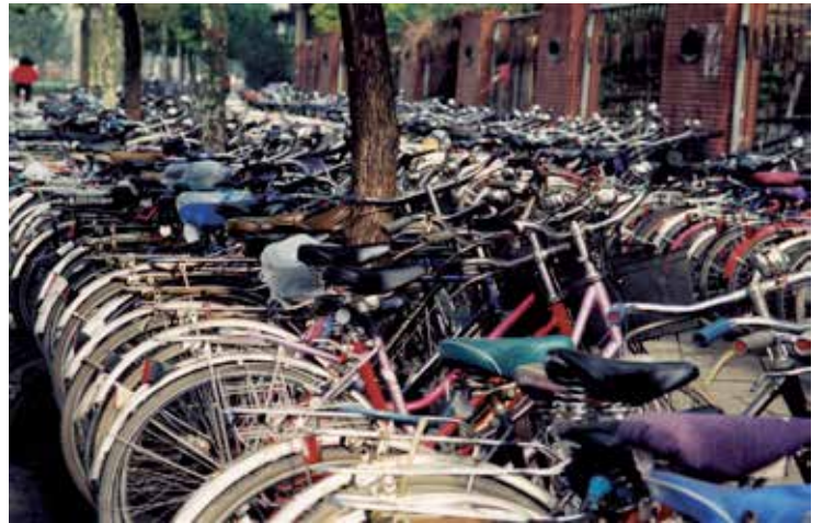
Chine, 870, 1994